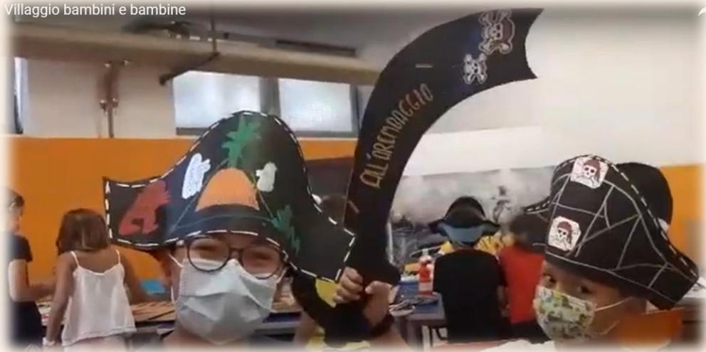
Villaggio bambini e bambine